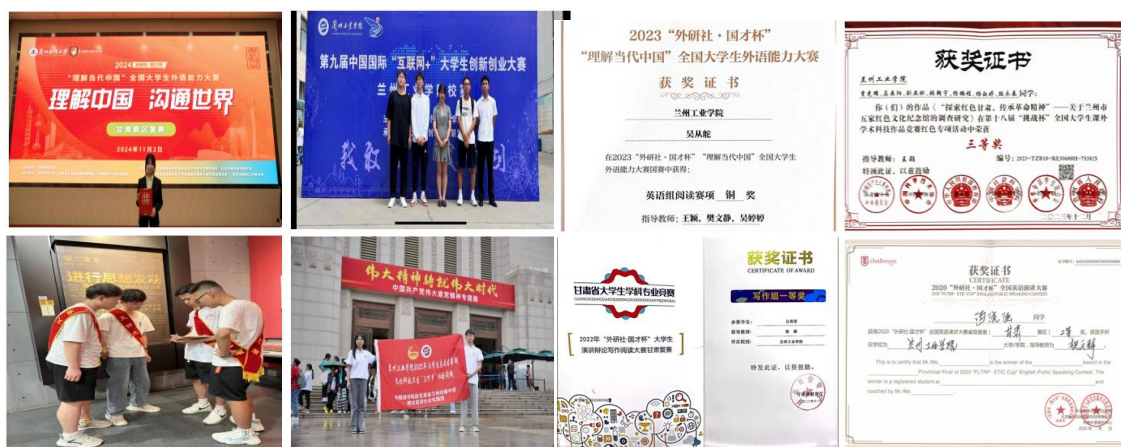
图 1 学生参与志愿活动及各类比赛

单位，为外国游客提供英文解说服务，将传播中国文化落到实处。这些都体现了大学英语课程思政培根铸魂的固本强基作用。