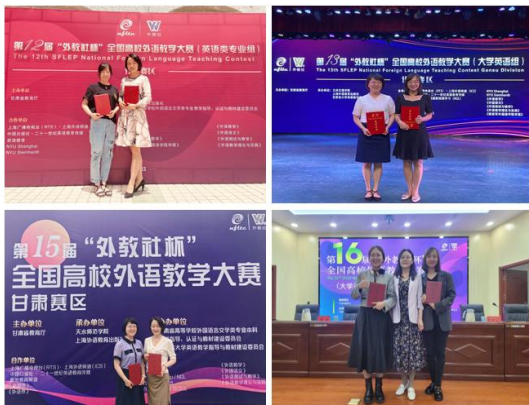
第十六届“外教社杯”全国高校外语教学大赛 (大学英语组)甘肃赛区(综合组)获奖名单